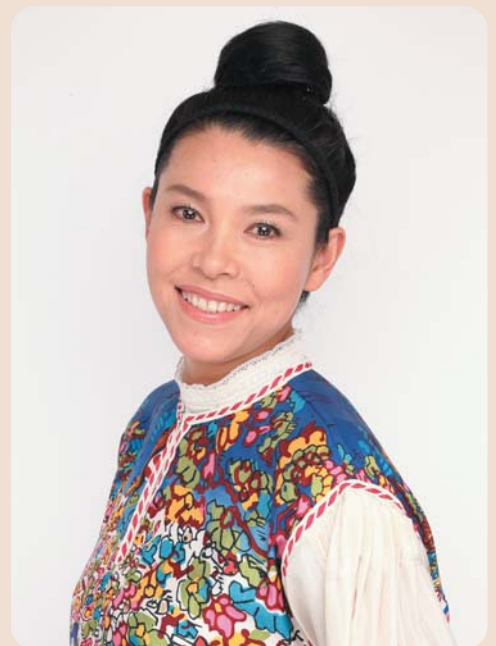
■ 林 マヤ(芸農タレント・ファッションモデル)